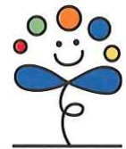
とよた市民後見人 ロゴマーク「けんり君」